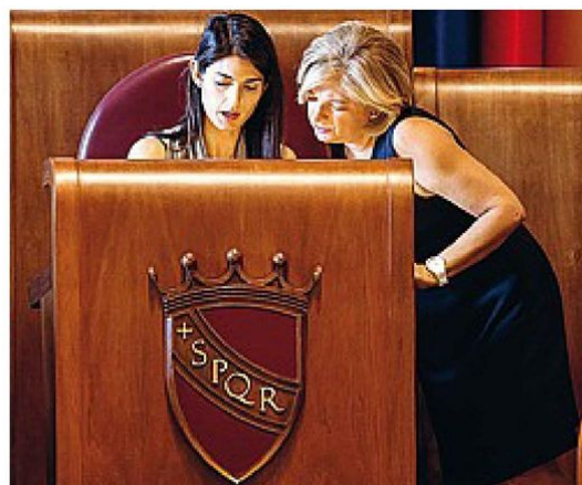
In Aula La sindaca Virginia Raggi e l'assessora all'Ambiente Paola Muraro

Ama Roma spa è l'azienda municipalizzata del Comune di Roma per la raccolta, il trattamento e lo smaltimento dei rifiuti solidi urbani, per l'espletamento dei servizi cimiteriali e per il mantenimento del decoro urbano.