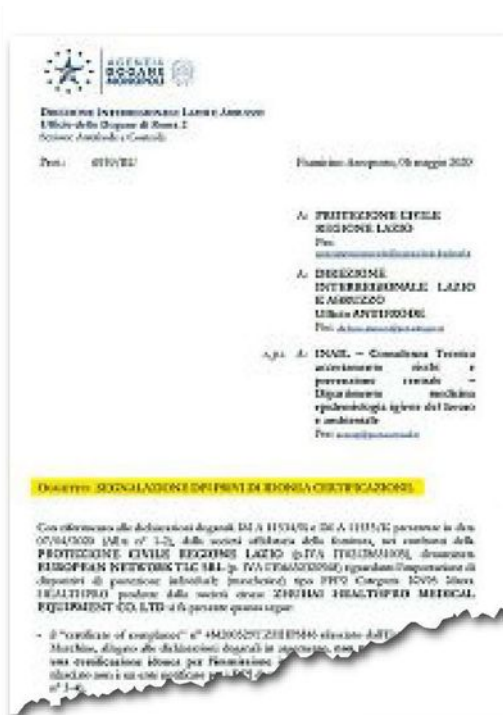
La segnalazione L'informativa con la quale l'Agenzia delle dogane segnala la mancanza di idonea certificazione delle mascherine importate dalla Cina